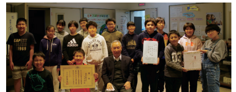
文部科学大臣賞 東京都立大塚ろう学校 小学部6年生

第三十二回全国聾学校合奏コンクール表彰式は、新型コロナウイルス感染拡大のため表彰式としては実施できませんでした。その代わりに、令和三年二月十九日(金)に、東京都立大塚ろう学校に協会が賞状等を直接届け授与式を行いました。